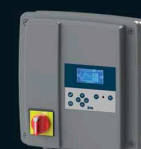
Boîtier de commande interactif SMART