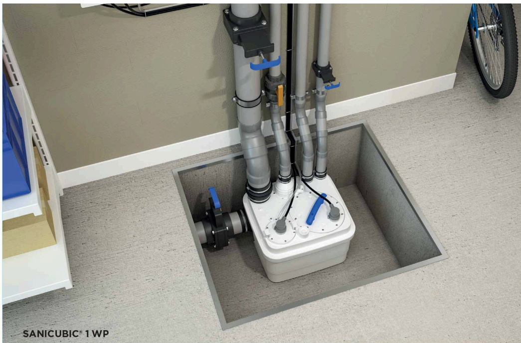
SANICUBIC® 1 WP