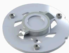
Couteau ProX K2

Pour plus d'informations techniques rendez-vous sur WWW.SFA.FR